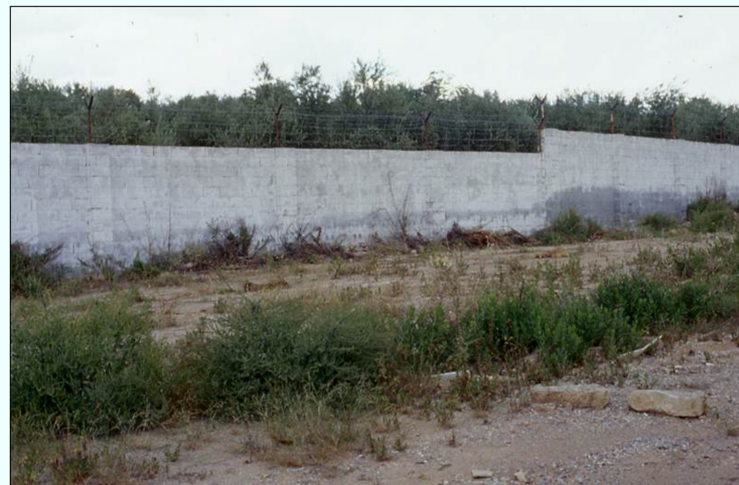
Figura 2. Fundición de plomo en Pulianas, cerrada en 1992 por la contaminación que ocasionó en el entorno.

Como se aprecia en la Tabla 1, los suelos y sedimentos de las zonas de muestreo presentan un amplio rango en las concentraciones de metales: 1211-16898 mg kg -1 Pb, 394-5598 mg kg -1 Zn y 36-203 mg kg -1 Cu. En las zonas estudiadas se han recolectado 28 especies de plantas, pertenecientes a 27 géneros y 12 familias botánicas (6 asteráceas, 4 quenoquiáceas, 4 brasicáceas, 3 poáceas y 11 de otras 8 familias). De estas 28 especies, 7 son anuales y 21 perennes (15 leñosas y 6 herbáceas). El número de especies por localidad es muy bajo comparado con las áreas próximas no contaminadas, oscilando entre 6 especies en Castala o Almagrera y 11 en Linares. Del total de especies se han seleccionado las 11 con mayor producción de biomasa y espectro ecológico para analizar su concentración en Pb, Zn y Cu, y posteriormente los valores de TR, TS y S/R (Tabla 2). Las dos especies dominantes en todas las localidades fueron Dittrichia viscosa y Piptatherum miliaceum , salvo en las minas de Almagrera, donde estaban ausentes debido a las condiciones de aridez y eran predominantes Salsola genistoides y Hammada articulata .