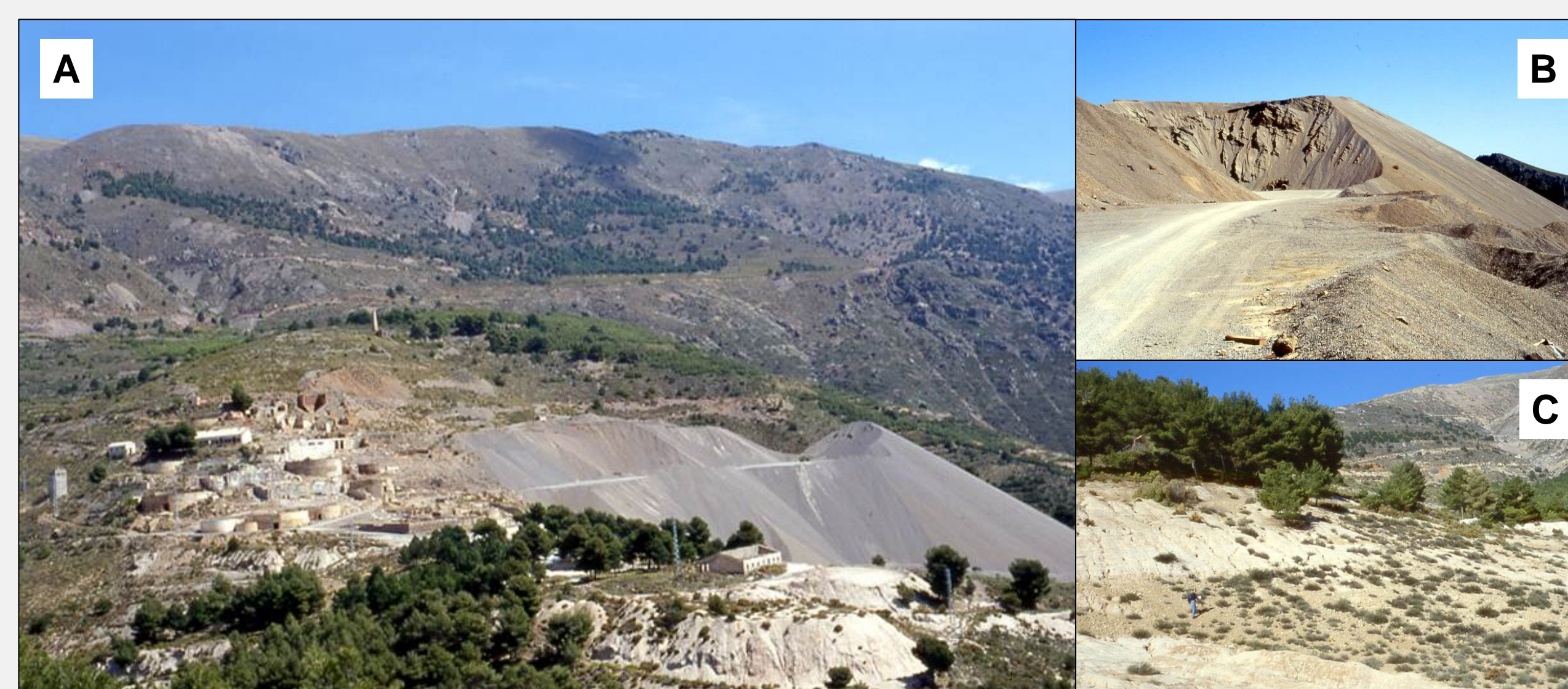
Figura 3. Minas de Almagrera, en la Sierra de Gádor (Almería). Actualmente están cerradas pero fueron explotadas desde los tiempos de los romanos hasta hace pocas décadas para la extracción de plomo. No obstante, hoy día se emplean las grandes cantidades de escombros como áridos. A: Panorámica. B: Escombreras. C: Lavaderos.