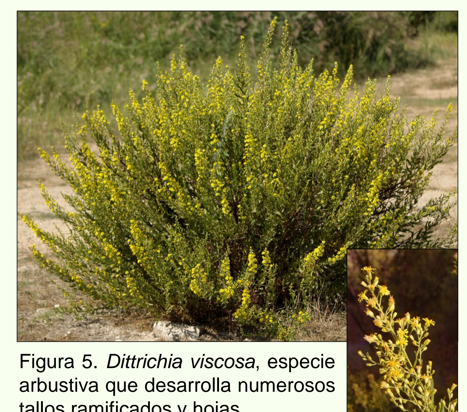
Figura 5. Dittrichia viscosa , especie arbustiva que desarrolla numerosos tallos ramificados y hojas.

De todas las especies analizadas, Dittrichia viscosa (Figura 5) es la que presenta mayor potencial para ser utilizada en la fitoextracción de Pb, Zn o Cu. Su capacidad poco común de translocar eficientemente metales desde las raíces hasta la parte aérea, unida a su amplia valencia ecológica y extensa distribución en clima mediterráneo, además de su considerable producción de biomasa, hacen de ella una especie muy prometedora en fitorrecuperación de suelos contaminados de la región Mediterránea. Esta especie arbustiva de hasta 1,5 m de altura puede ser cultivada y cosechada en los enclaves contaminados, siendo capaz de rebrotar de las cepas después de ser segada. No obstante, son necesarios nuevos estudios para optimizar la captación de metales, su producción de biomasa y las prácticas agronómicas antes de ser utilizada.