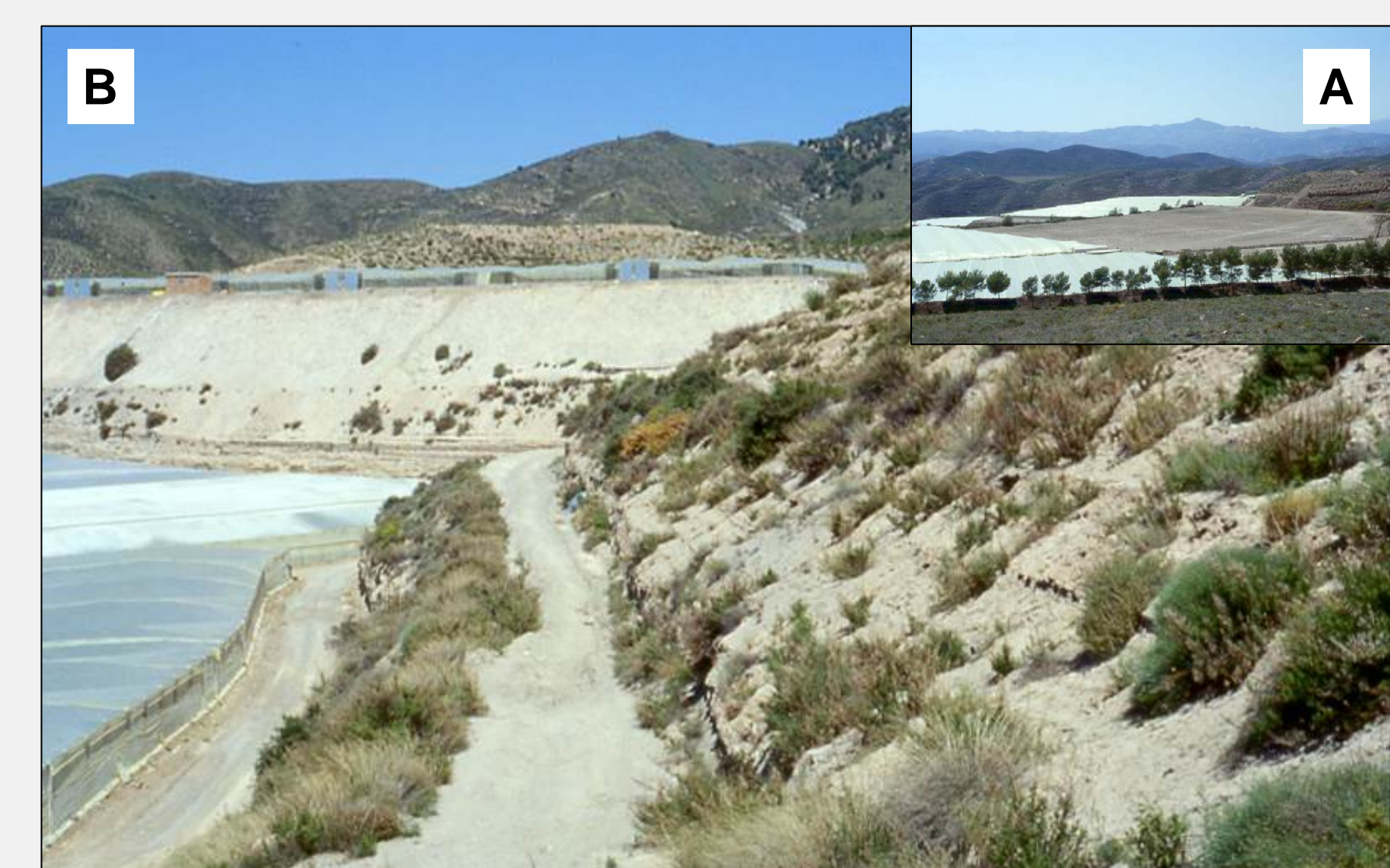
Figura 4. Balsas de sedimentación de Castala, ligadas a varias minas de la Sierra de Gádor, entre ellas la de Almagrera, y actualmente cubiertas en parte por invernaderos. A: Vista panorámica. B: Detalle de taludes.